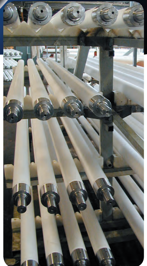
Rollen mit Metallendkappen / rollers with metal end-caps

Vitreous fused silica rollers are used in both continuous and reversible furnaces from various furnace manufacturers and operators. W. Haldenwanger vitreous fused silica rollers are in successful use throughout the world in the flat glass industry.