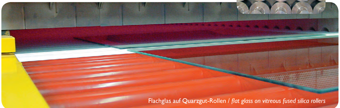
Flachglas auf Quarzgut-Rollen / flat glass on vitreous fused silica rollers